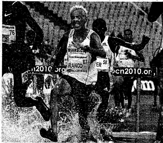
Blanco, en una imatge d'arxiu a l'Estadi Olímpic.

Un altre dels focus d'atenció de la reunió era el debut de la tarragonina Natàlia Rodríguez, en el mateix escenari en què el curs passat va enlluernar amb la victòria en els 3.000 m i la millor marca mundial de l'any (8:35.86). Aquest cop la subcampiona mundial de 1.500 m en pista coberta va haver de cedir el